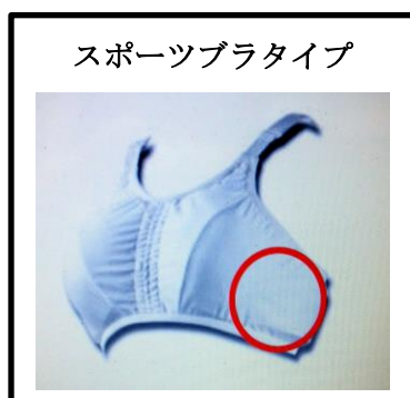
〈着用 OK のチェストガード〉